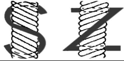
右撚り（S撚り） 左撚り（Z撚り） 撚り方向

糸の撚り方向にはS（右）撚りとZ（左）撚りの2種類があります。普通、紡績糸の単糸（紡績工程で作られた1本の糸）には、Z（左）撚りがかかっています。